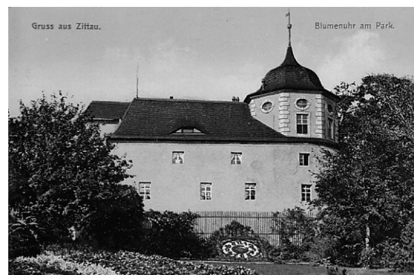
Die Fleischerbastei mit Blumenuhr 1910.