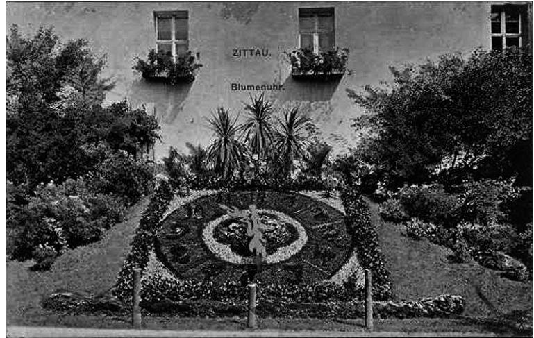
Die Blumenuhr im Jahre 1912.

Zu allen Salaten reichen wir Kräuterbutter-Baguette.