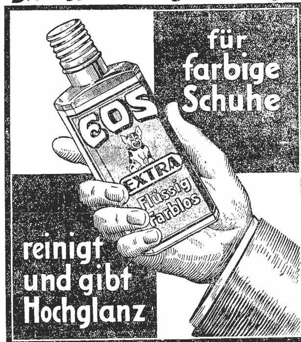
GEBRÜDER KRONER, Eos-Werke, Berlin-Danzig